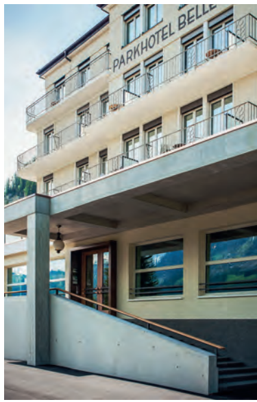
Das Parkhotel Bellevue in Adelboden ist einer der wenigen Hotelbauten der Moderne in der Schweiz.