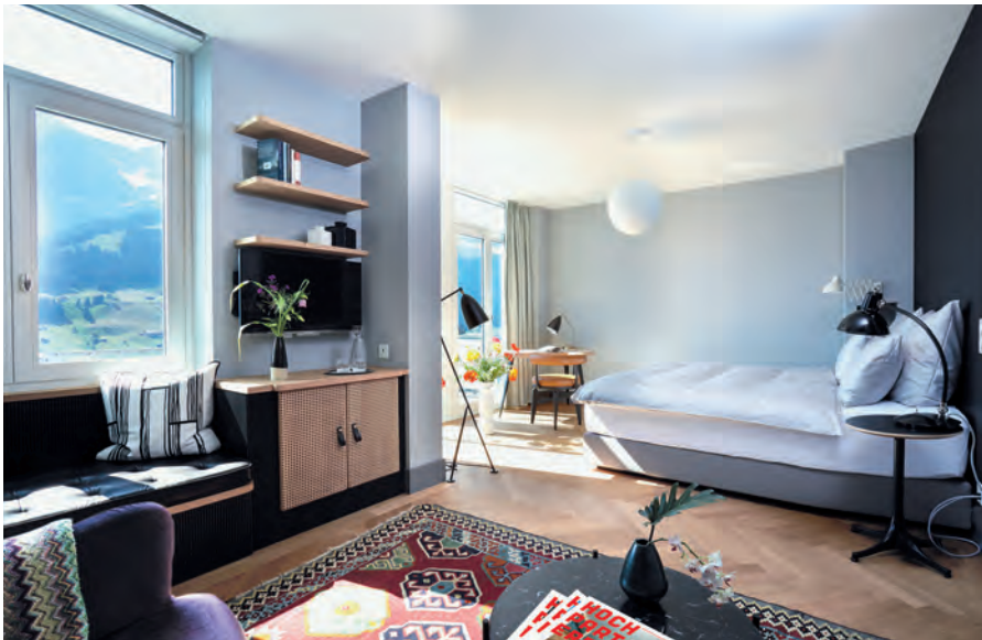
Der Hotelgast lebt öfters im Zimmer als sein Vorfahre. Er braucht ein grosses Bett, Mobiliar mit Stil und Schwung der Fünfzigerjahre und genügend Platz für den Bergblick.