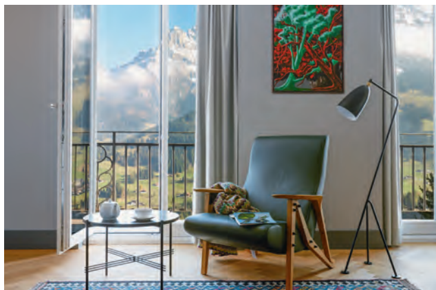
Hinweg mit dem Spannteppich, herbei der Parkettboden und hinein in den Sessel «Gilda», den Carlo Mollino 1954 für die Casa del Sole in Cervina entworfen hatte.